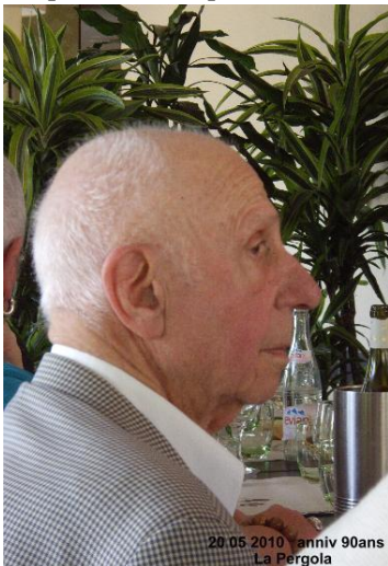
20.05.2010 Anniv 90ans La Pergola